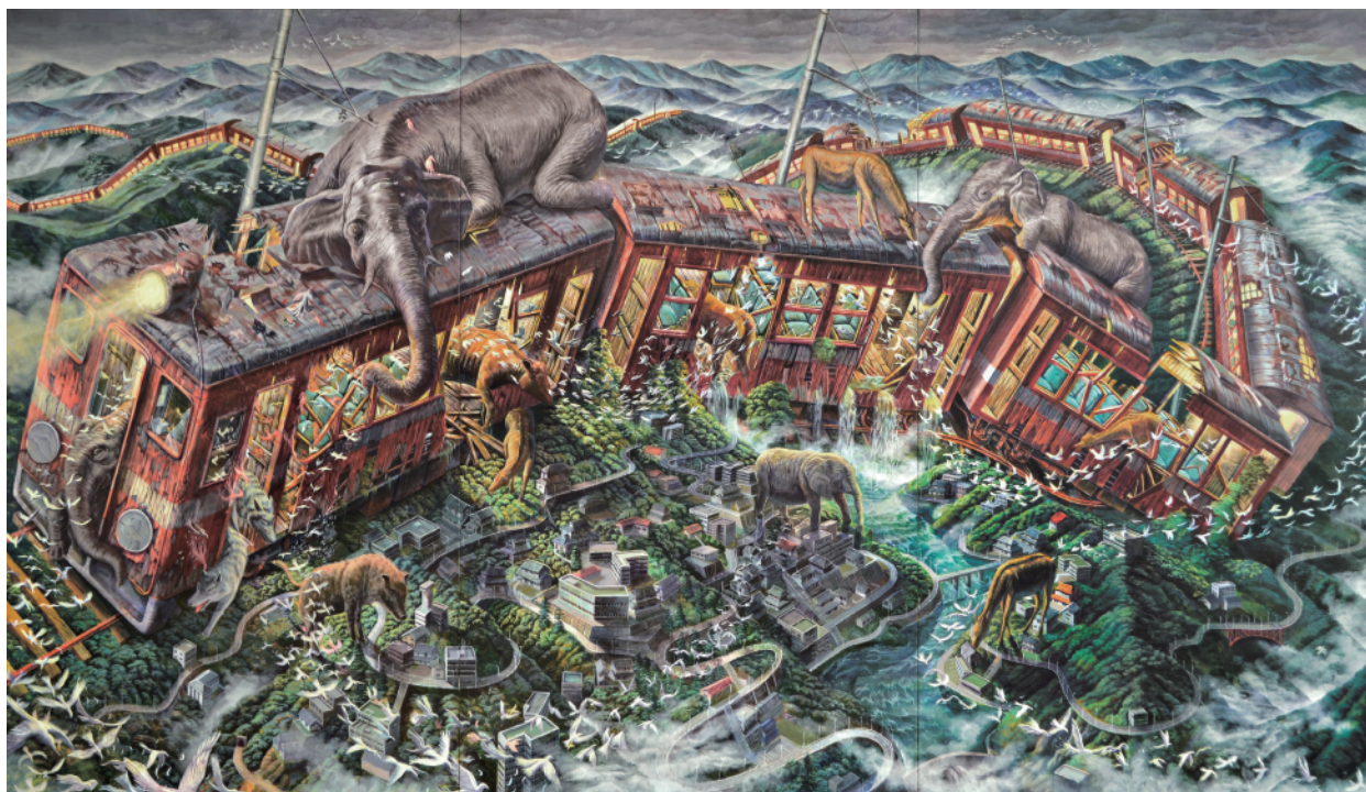
Yasuhiro Asai 3.18 tue - 4.1 tue