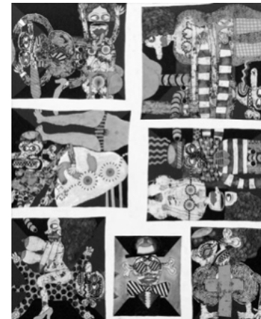
平賀敬「H氏の優雅な生活」1969年 油彩、キャンバス 162.2×130.3cm 第10回サンパウロ・ビエンナーレ出展作

リでの経験が私の価値観に大きな影響を与えていると思います」と当時を振り返る。その後、兄が銀座にフマギャラリーを開くというところで帰国。兄のもとで働くことになる。フマギャラリーは、その当時は珍しかった打ちっ放しの天井をはじめ、コレクションをしたいた戦後現代美術作家の展覧会、さらには福田繁雄、永井一正らグラフィックの展覧会を行ったりと、異彩を放っていた。寺山修司、澁澤龍彦、黒柳徹子、篠山紀信、宇野亜喜良、吉行淳之介、横尾忠則等、多数の文化人が訪れていたという。文京アート設立へ