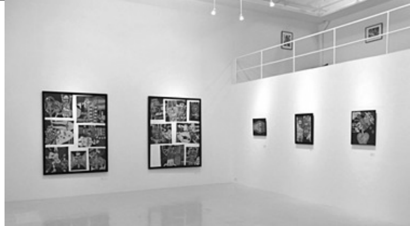
昨年7月に八丁堀に引っ越した FUMA Contemporary Tokyo / BUNKYO ARTの会場。天井高は6m。

文京アートといえば、平賀敬、小山田二郎、金子國義、鶴岡政男など、戦後現代美術の異色作家を扱ってきたことで知られているが、2003年頃からは、若手作家も扱っている。「長い間、扱ってきた戦後現代美術の価値が上がってきたおかげで、若い作家を応援する余裕が